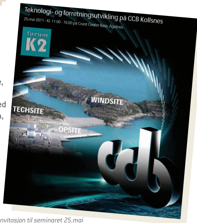
Invitasjon til seminaret 25.mai