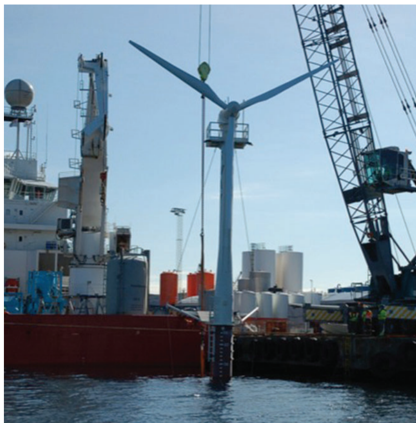
Utsetting av testmodellen til Sway på Kollsnes

Siste stopp på turen var Fiskarbondens marknad på Sartor Storsenter. Her fekk deltakerane ein smak av Glesværs berømte lakseburgarar, samt mulegheita til å smake og kjøpe regionens eige utval av lokale matvarer.